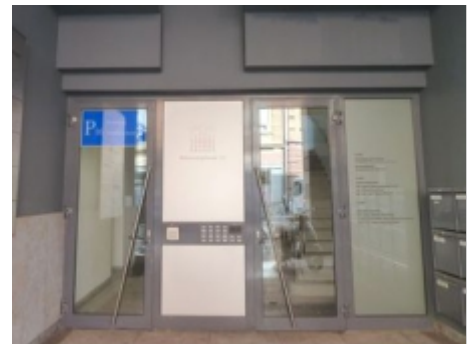
Zugang (Fußgänger): Brückenkopfstraße