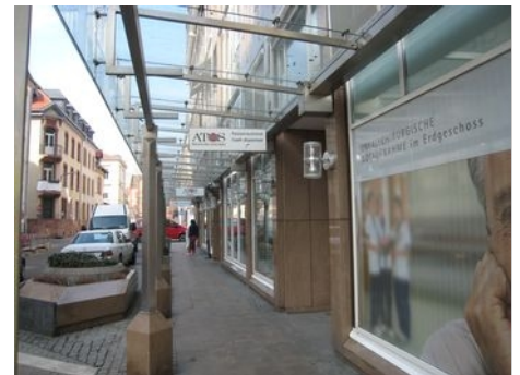
Zugang (Fußgänger): Luisenstraße