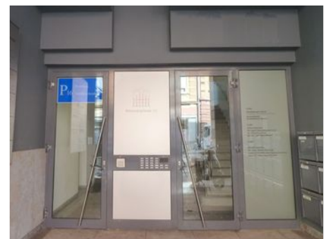
Zugang (Fußgänger): Brückenkopfstraße