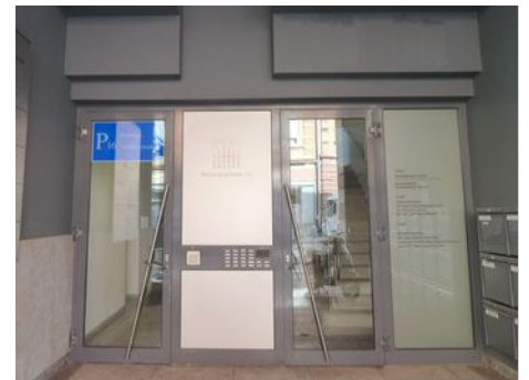
Zugang (Fußgänger): Brückenkopfstraße