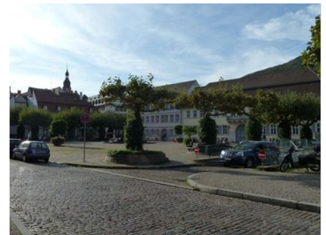
Ausfahrt: Karlstraße (Karlsplatz)