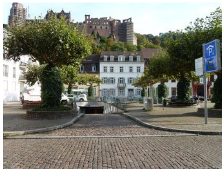
Einfahrt: Hauptstraße (Karlsplatz)